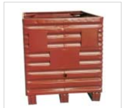
Metallboxe 2330, Frontansicht Boxe métallique 2330, vue frontale