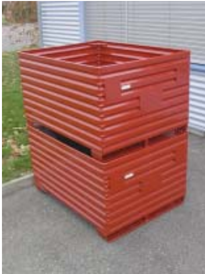
Metallboxe 2360, gestapelt Boxe métallique 2360, superposé