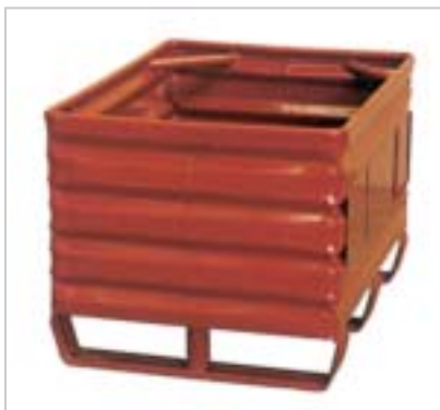
Metallboxe 2302, Füllhöhe 400 mm Boxe métallique 2302, hauteur de remplissage 400 mm

Fettgedruckte Grössen sind Normausführungen. Dimensions normalisées imprimées en gras.