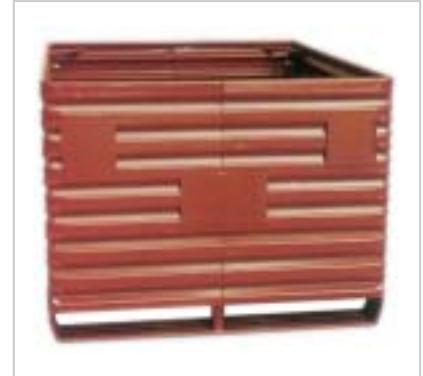
Metallboxe 2360, Grundmass 1600 x 1200 mm Boxe métallique 2360, dimensions 1600 x 1200 mm