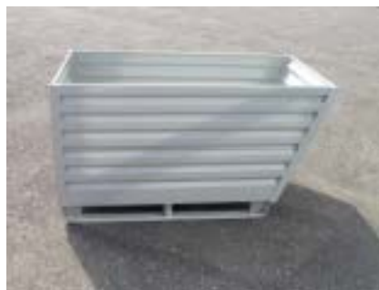
Kippmulde mit verstärkten Füßen Bac verseur avec pieds renforcés