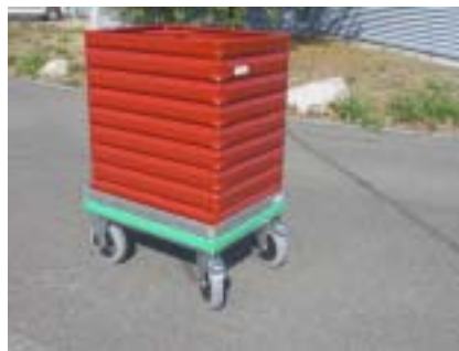
Metallboxe Typ 2310 mit Logistik-Roller Boxe métallique 2310, avec chariot roulant en profil cornière