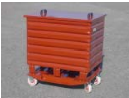
Metallboxe mit Auflegedeckel, unterfahrbar mit Handhubwagen Boxe métallique avec couvercle libre, manutention à l'aide de grues, de palans, de transpalettes