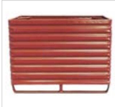
Metallboxe 2330, Füllhöhe 800 mm Boxe métallique 2330, hauteur de remplissage 800 mm