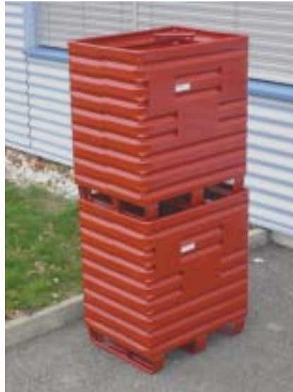
Metallboxe Typ 2310 gestapelt Boxe métallique 2310, superposé