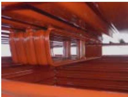
Boxenfuss (quer) zu Typ 2360 Pieds Type 2360